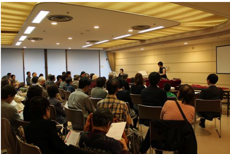
2016年11月12日 伝道支援プログラムを行った、地域の公共施設(赤羽会館)